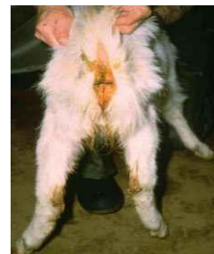
PPR коза: диария Задните четвъртинки са замърсени с течни изпражнения

В течение на развитие на заболяването е характерен лошият дъх от устата на животното. Поради изпитваната болка животните силно се съпротивляват на опитите за отваряне на устата.