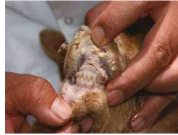
PPR коза: късни лезии в устата Лигавицата на устата е напълно покрита с гъста сиреноподобен материал; плитки ерозии се намират под повърхността на мъртвите клетки.

Под некротичната тъкан може да се наблюдават плитки ерозии. При по-леко протичащи случаи, ерозиите трудно се забелязват и се изисква внимателен преглед, за да бъдат констатирани. В слаби случаи тези промени не могат да бъдат сериозни и се нуждаят от внимателен преглед за да бъдат видяни. Нежно протриване през венеца и небцето с пръст може да даде ихорозен материал съдържайки късчета епителна тъкан. Подобни промени могат да също така бъдат видяни в mucous membranes /лигавиците /на носа, вулвата и вагината. Често устните се подуват уголемяват напукват се и се покриват със струпеи.