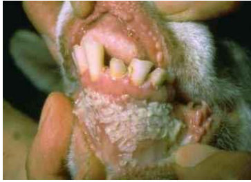
PPR коза: ранни лезии в устата, показващи области на мъртви клетки ; бледи, сиви области на мъртви клетки по венците.