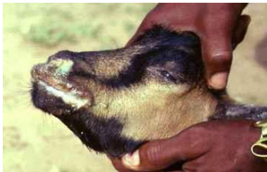
PPR коза: подути, ерозирани устни Устните са надуты, едематозни и се виждат области на ерозия.

Под некротичната тъкан може да се наблюдават плитки ерозии. При по-леко протичащи случаи, ерозиите трудно се забелязват и се изисква внимателен преглед, за да бъдат констатирани. В слаби случаи тези промени не могат да бъдат сериозни и се нуждаят от внимателен преглед за да бъдат видяни. Нежно протриване през венеца и небцето с пръст може да даде ихорозен материал съдържайки късчета епителна тъкан. Подобни промени могат да също така бъдат видяни в mucous membranes /лигавиците /на носа, вулвата и вагината. Често устните се подуват уголемяват напукват се и се покриват със струпеи.