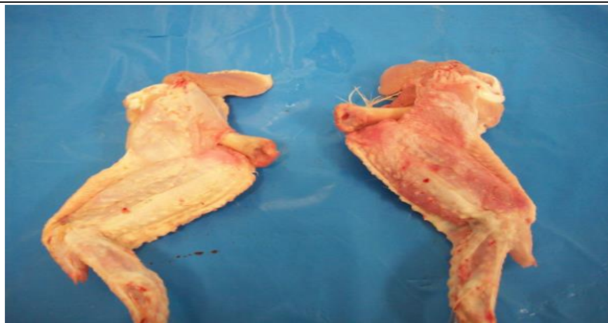
Изкълчване: увреждане при обработката Изкълчване: поради нараняване

От тази снимка е видна разликата между увреждане при обработката вляво и наранявания вследствие на улавянето/транспортирането.