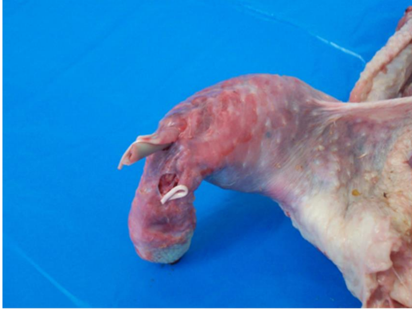
Фрактура на крака с кървене