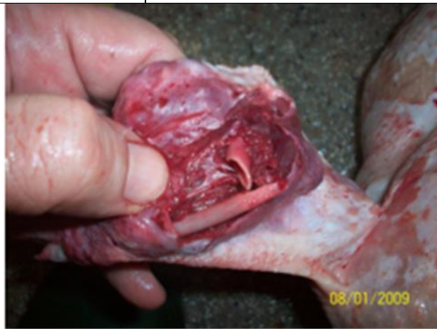
Кървоизлив вследствие на фрактура с основно нараняване — счупване